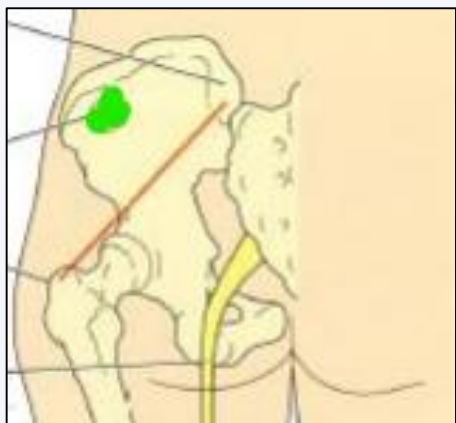
Zone dorso glutéale