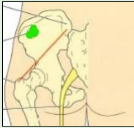
Zone dorso glutéale

Privilégier la zone ventro-glutéale: moins douloureuse et plus sûre (absence de structure nerveuse et vasculaire)