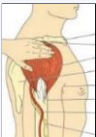
Zone du deltoïde