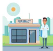
Dispensation par l'officine de ville