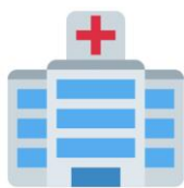
Prescription par un professionnel de santé au sein d'un établissement de santé