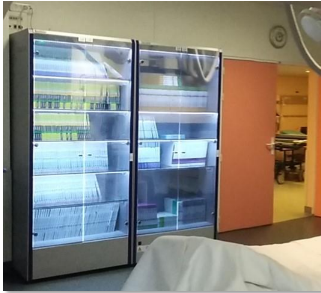
2 armoires : Stents