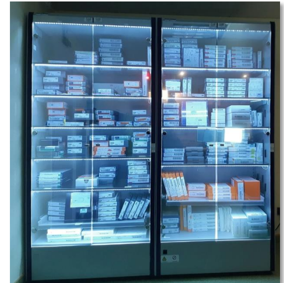
2 armoires : Pacemakers et sondes

Plateau Technique Interventionnel de cardiologie interventionnelle