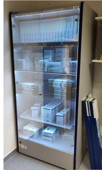
1 armoire : Valves TAVI